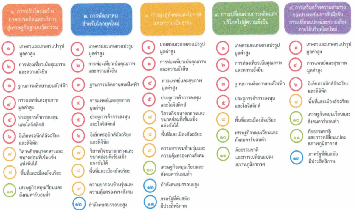
แผนภาพที่ ๓.๑ ความเชื่อมโยงระหว่างหมวดหมู่การพัฒนากับเป้าหมายหลัก

ความเชื่อมโยงระหว่างหมวดหมู่การพัฒนากับเป้าหมายหลักแสดงไว้ในแผนภาพที่ ๓.๑ โดยหมวดหมู่ การพัฒนาที่กำหนดขึ้นเป็นประเด็นที่มีลักษณะเชิงบูรณาการที่ครอบคลุมการพัฒนาตั้งแต่ในระดับต้นน้ำจนถึง ปลายน้ำ และสามารถนำไปสู่ผลพัฒนาทั้งในมิติเศรษฐกิจ สังคม ทรัพยากรธรรมชาติและสิ่งแวดล้อมไปพร้อมๆ กัน ทำให้หมวดหมู่แต่ละประการสามารถสนับสนุนเป้าหมายหลักได้มากกว่าหนึ่งข้อ นอกจากนี้การพัฒนากายได้ แต่ละหมวดหมู่ไม่ได้แยกขาดจากกัน แต่มีการสนับสนุนหรือเอื้อประโยชน์ซึ่งกันและกัน